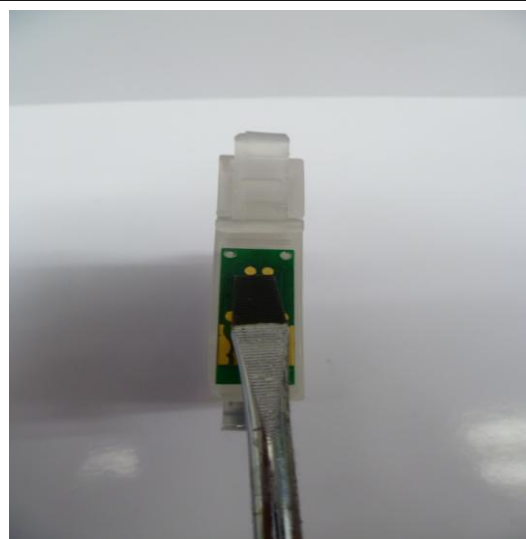
T1281-84 y T1291-94